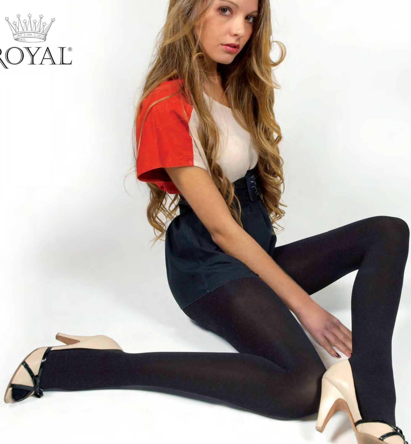
4058 COLLANT VELVET 100 DEN