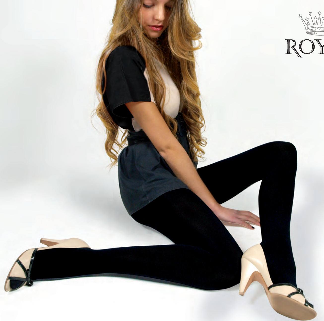
4052 COLLANT MICRO 300 DEN